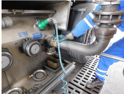
Napojení rekuperačního ramene