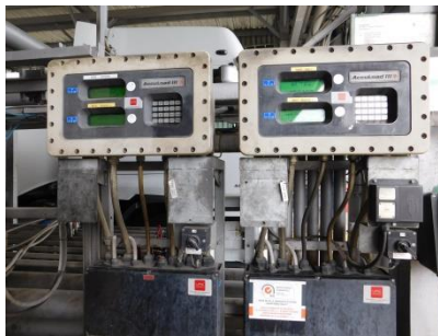
Přihlášení na ACCULOAD, navolení množství produktu do jednotlivých komor