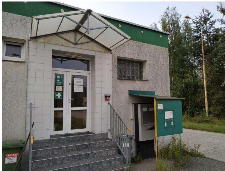
ČEPRO, a.s., Dělnická 213/12, Holešovice, 170 00 Praha 7