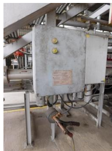
Zemní bod technologie výdejních lávek – napojení je signalizováno