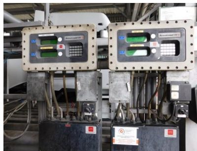
Přihlášení na ACCULOAD, navolení množství produktu do jednotlivých komor