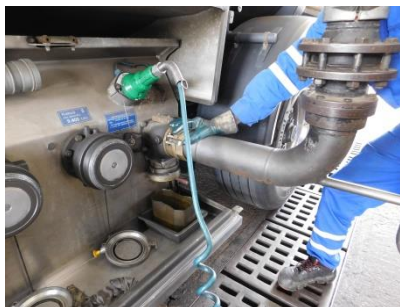
Napojení rekuperačního ramene