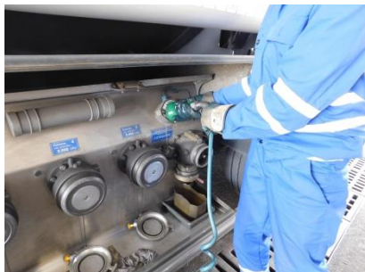
Napojení systému CIVACON