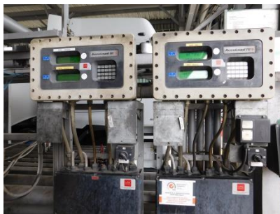
Přihlášení na ACCULOAD, navolení množství produktu do jednotlivých komor