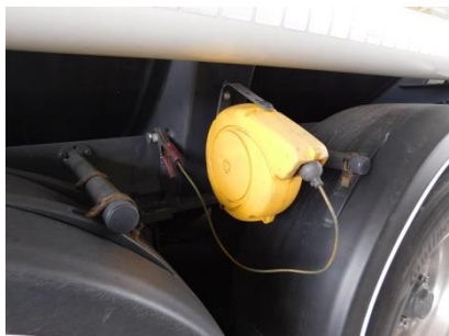
Zemní bod cisterny