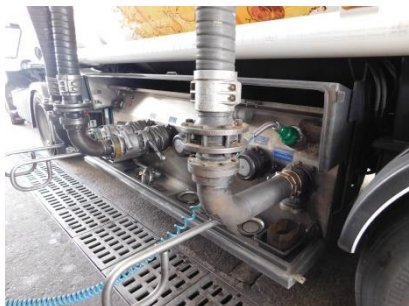
Napojení výdejních ramen pohonných hmot