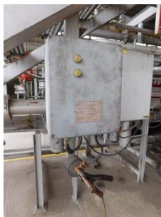
Zemní bod technologie výdejních lávek – napojení je signalizováno